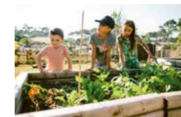
Notre jardin des sens comestible et participatif est ouvert à tous.

Le secret de votre parenthèse enchantée ? Un aménagement paysager, au service de la nature. Depuis sa création, Naturéo travaille en partenariat avec l'Office National des Forêts pour pérenniser le village en harmonie avec la pinède de 13 hectares.