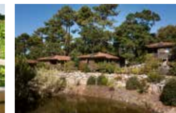
Dans l'étang, se nichent grenouilles et canards colverts.